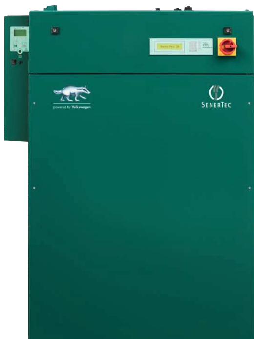
Dachs Pro 20 powered by Volkswagen