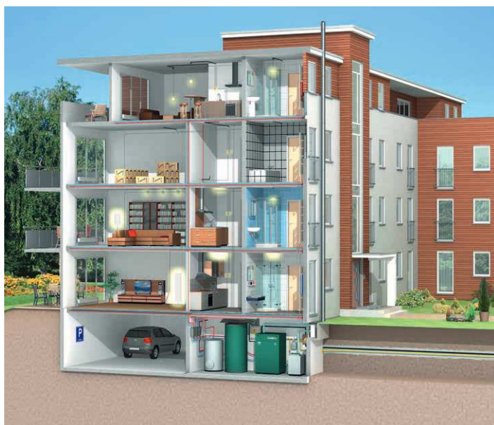
Dachs Pro 20 mit Systemkomponenten

Mit dem neuen Dachs Pro 20 können auch Gebäude mit hohem Wärme- und Stromverbrauch ihre Energiekosten klimafreundlich und effizient senken. Nach dem Prinzip der Kraft-Wärme-Kopplung (KWK) erzeugt der Dachs Pro 20 Strom und Wärme in einem Schritt – direkt am Ort des Verbrauchs. Indem die Anlage den eingesetzten Brennstoff doppelt nutzt, reduzieren sich sowohl der Ressourcenverbrauch als auch die CO 2 -Emissionen gegenüber dem separaten Energiebezug erheblich. Den beim Heizen erzeugten Strom können Betreiber selbst nutzen und Überschüsse gegen eine Vergütung ins öffentliche Netz einspeisen.