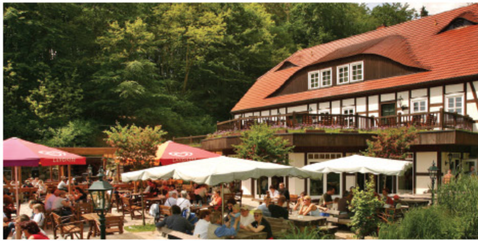
Hotels, Gastronomie, öffentliche Einrichtungen