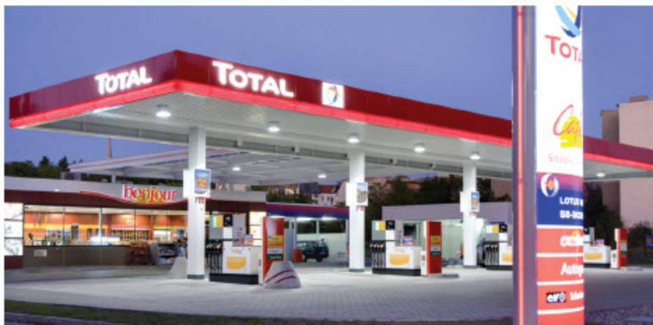
Industrie-, Handels- und Handwerksbetriebe