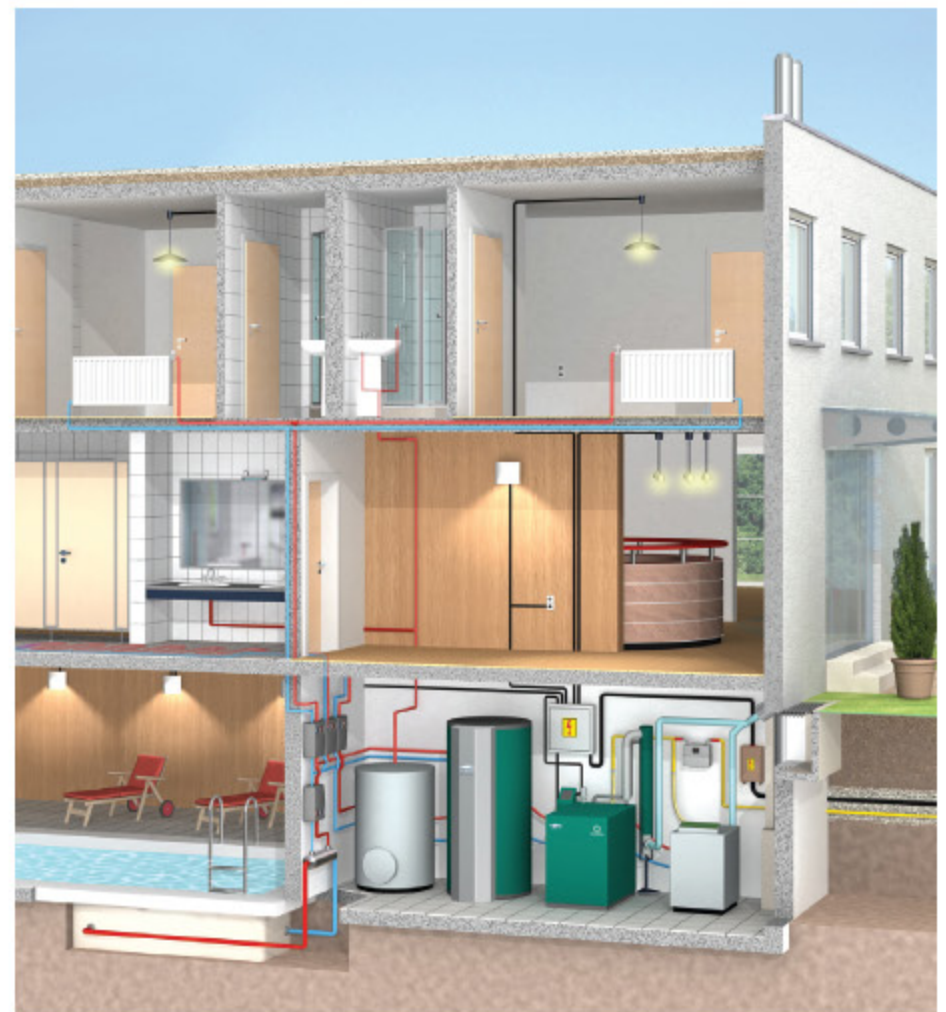
Elektrische und heizungstechnische Einbindung im Gewerbebetrieb mit dem Dachs SEplus

Die Zukunft liegt nicht in „Heizsystemen, die Strom verbrauchen“, sondern in „Heizsystemen, die Strom erzeugen“.